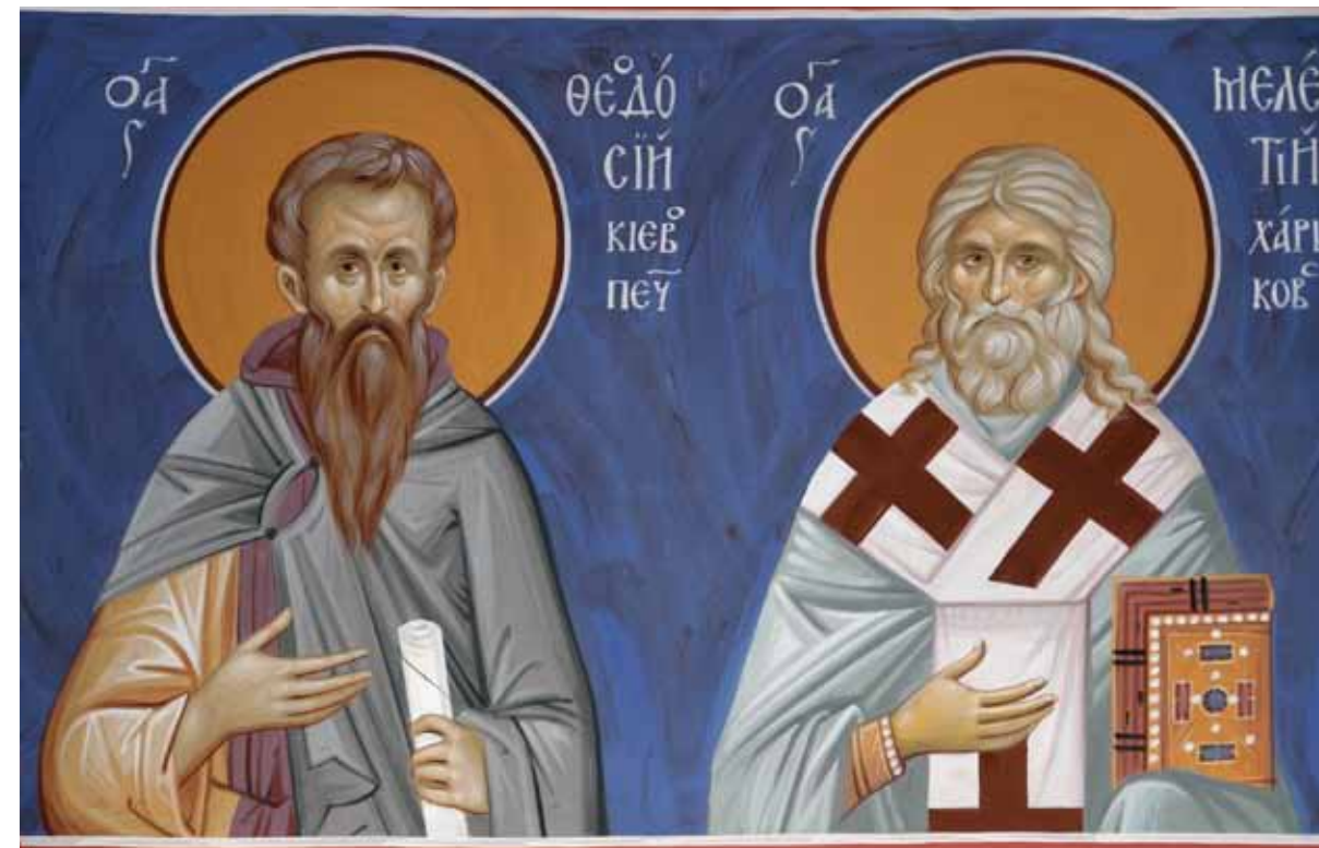
Фрагмент росписи. Илья Терентьев

(фактически Шестого Вселенского) собора о недопустимости чувственных ассоциаций, производимых изображением. А далее идет разнообразие эпох и региональных особенностей в церковном искусстве. Конечно, чисто академическое направление ставило иные задачи, но уже в XIX столетии ряд художников попробовали найти компромисс. Да, есть более или менее удачные попытки, как и в более древнем искусстве что-то может