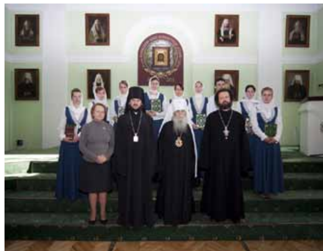
Портрет Святейшего Патриарха Московского и Всея Руси Кирилла Художник Федор Олевский Церемония вручения