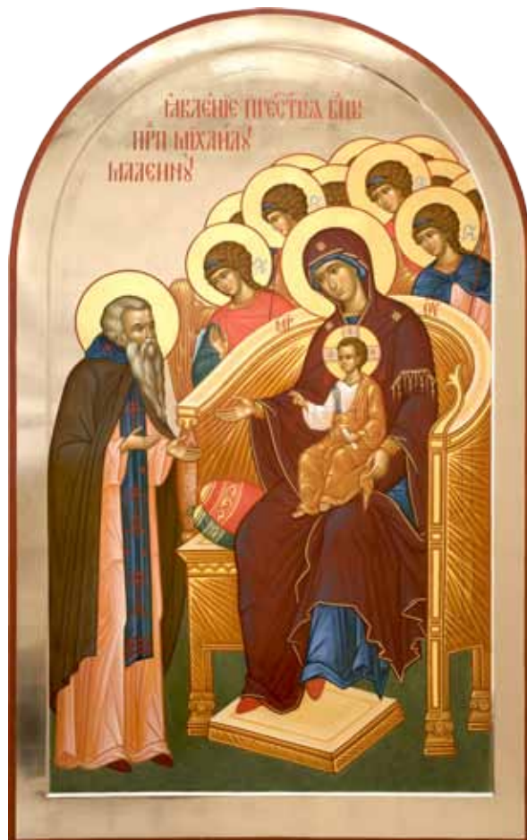
Моление преп. Михаила Малеина Валентина Жданова. 2013

Матери и Успения Пресвятой Богородицы (1998–2007 гг.). В настоящее время эта же группа мастеров работает над воссозданием иконописного ряда собора Федоровской иконы Божией Матери. Иконы Кусова находятся в храмах и частных собраниях России (Санкт-Петербург, Новгород), Финляндии, Франции.