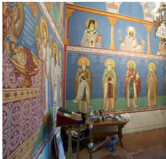
Храм Святителей Иннокентия и Софрония Иркутских Роспись под руководством Дмитрия Мироненко