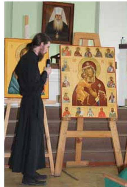
На занятиях в мастерской

Иконописное дело в России, активно возрождавшееся еще на рубеже XIX–XX веков, конечно, не исчезло совсем в после-революционное время, но претерпело трудности. Под советской властью оно могло сначала существовать почти только в реставрационной сфере, где, впрочем, были достигнуты весьма немалые успехи 1 . В эмиграции по-разному складывались творческие обстоятельства – наиболее новаторски во Франции, наиболее традиционно в рамках Зарубежной Церкви.