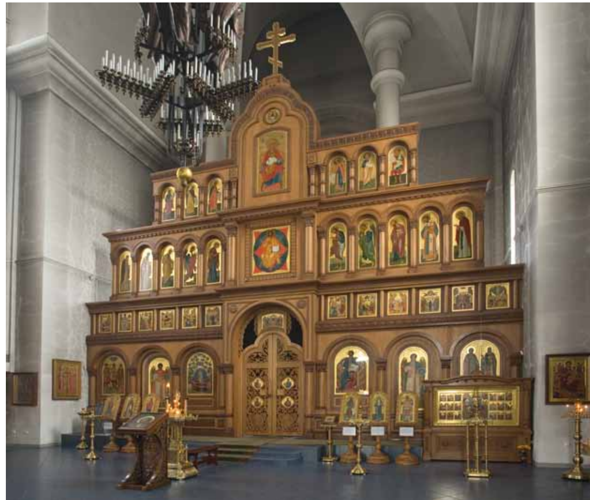
Иконостас храма Успения Пресвятой Богородицы (Блокадный храм) в Санкт-Петербурге