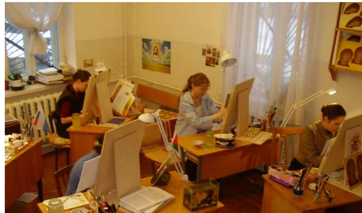
Занятия в иконописном классе

Опыт коллегиального решения сложных вопросов уместен и в области изобразительной. Так возникает непростая ситуация в дискуссии сторонников канонического и академического направлений. А решать эти сложные проблемы стоит в каждом случае индивидуально. Невозможно, конечно, возражать тому факту, что церковное искусство должно быть каноничным 17 , традиционным. Но означает ли это только набор известных