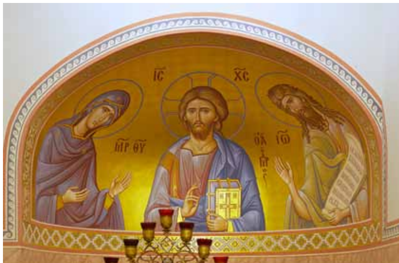
Церковь Св. пророка Иоанна Предтечи. Деисус Дмитрий Мироненко. 2012