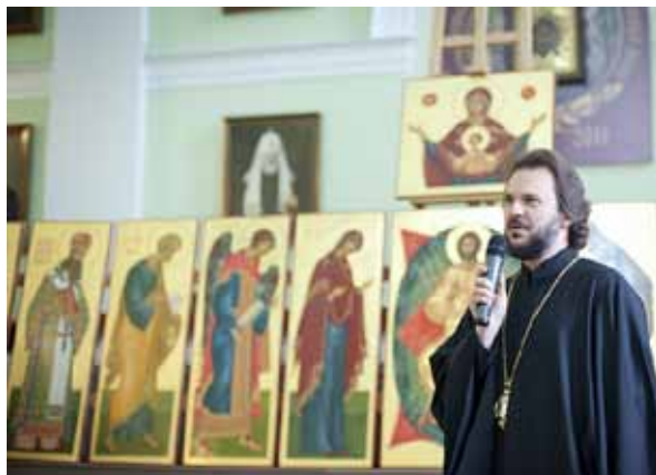
Владыка Ректор на защите дипломных работ Иконописного отделения

2011 года Святейший Патриарх Московский и всея Руси Кирилл освятил храм, который несет свою глубокую воспитательную миссию по отношению к новым поколениям студентов Духовной Академии 4 . Осенью 2012 года в стенах Академии художеств при участии обоих ректоров состоялось открытие выставки, посвященной этой замечательной работе наших молодых мастеров.