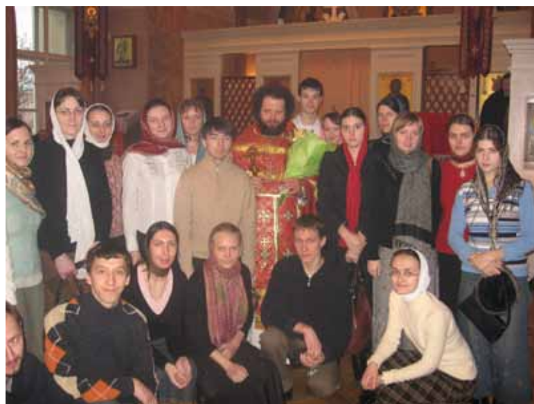
В храме Св. Екатерины в здании Академии художеств

Среди многочисленных выставок, прошедших за последнее время, научных конференций и публикаций трудов многие носят подчеркнuto церковно-академический характер. Особое место в этом ряду занимают: выставка 1996 года «Пути искусства к служению вере»; конференция 2004 года «Церковное искусство: модернизм и традиции»; конференция и выставка 2009 года, посвященные 250-летию создателя Казанского собора в Петербурге архитектора А. Н. Воронихина; конференция 2010 года, посвященная 200-летию вице-президента Императорской Академии художеств князя Г. Г. Гагарина; выставка 2011 года к 200-летию Казанского собора и другие.