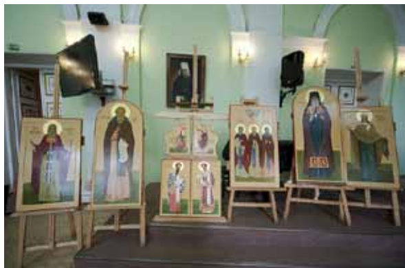
Перед защитой дипломных работ

общественного и экономического положения постсоветских государств. Вот тут-то и становится понятным, что возрождение иконописи в стенах Академии – это часть огромного дела и сложнейшего процесса воссоздания активной архитектурно-художественной жизни Русской Православной Церкви.