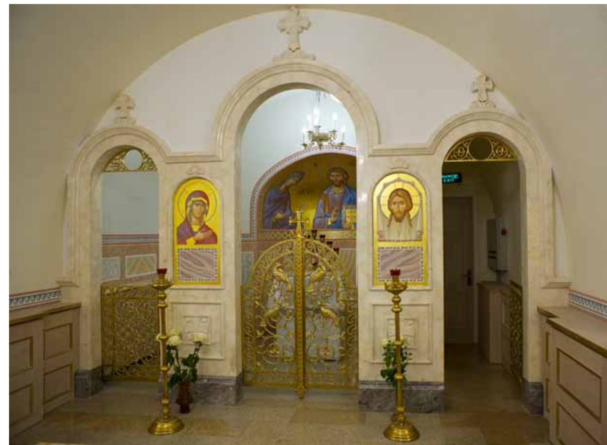
Церковь Св. пророка Иоанна Предтечи. Алтарная преграда Дмитрий Мироненко